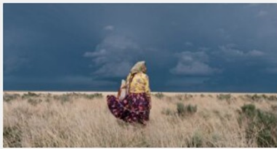
La mujer de estrellas y montañas di Santiago