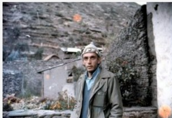
Cronica di un exilio