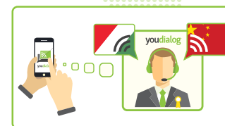
2 Connettiti con l'interprete