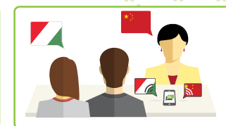
3 Metti il telefono in vivavoce